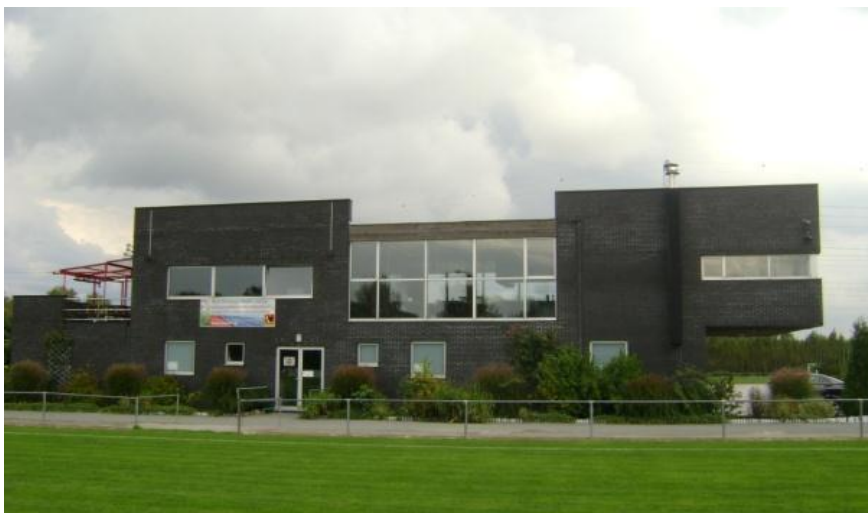
(kantine bovenaan + kleedkamers onderaan)